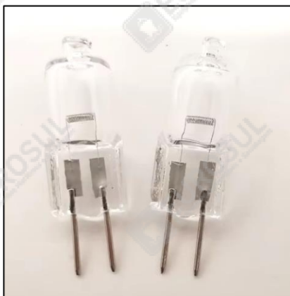
3. 12V, 13W, lâmpada halógena de tungstênio