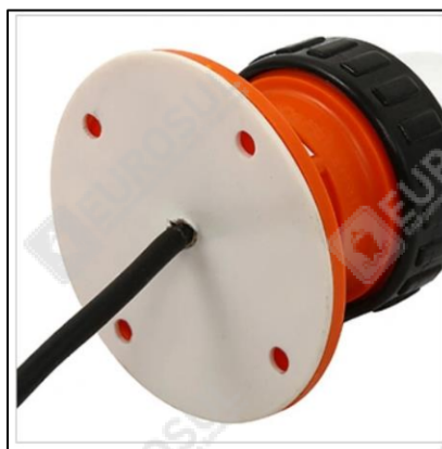
2. Vista inferior