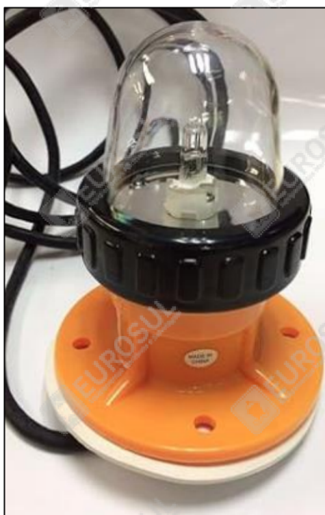
4. Vista lateral